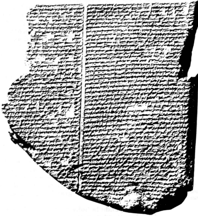
Extrait de la XI e tablette (le déluge). Bibliothèque d'Ashshurbanipal (VII e s. avant J.-C.)