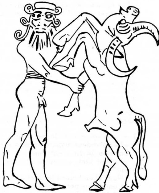
Gilgamesh et le Taureau Céleste (?) d'après un sceau-cylindre (vers 2500 av. J.-C.)