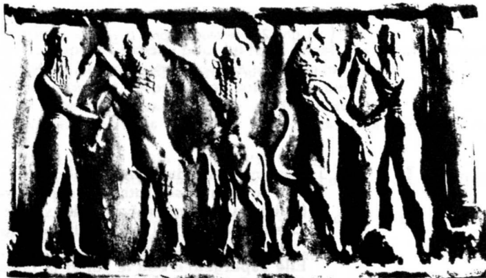
Sceau-cylindre représentant (?) Gilgamesh et Enkidou (vers 2250 av. J.-C.)