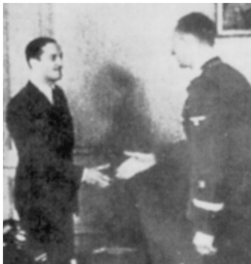
René Bousquet (à gauche) sert la main de Reinhard Heydrich (adjoint d'Heinrich Himmler), lors de leur rencontre à Paris le 6 mai 1942, où il promet la participation de la police française aux rafles dans les deux zones. Reinhard Heydrich sera exécuté trois semaines plus tard (le 27 mai), à Prague (Tchécoslovaquie), par des agents envoyés par Londres.

France, s'écoulent deux mois sans qu'aucun train ne soit parti en direction de l'Est. Les déportations ne reprennent que le 22 juin. Ce temps d'accalmie relative s'explique par la mobilisation totale du matériel ferroviaire indispensable à la préparation de l'offensive de printemps sur le front russe. En effet, le SS-Obersturmführer Dannecker (chef du service des affaires