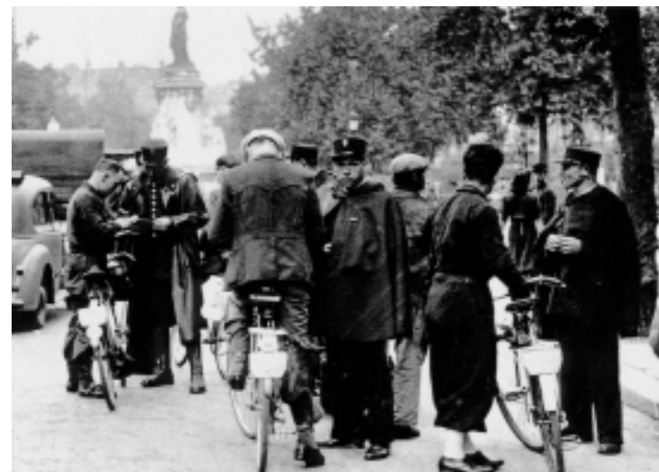
Rafle d'août 1941. Les Juifs arrêtés seront internés au camp de Drancy.

La presse collaborationniste de Paris, les journaux de la zone Sud justifient systématiquement les internements dans les camps du Loiret ou de Drancy, présentant les hommes comme des trafiquants de « marché noir ». L'Union des femmes juives (MOI) réagit par un tract adressé à la population française. Son texte est particulièrement significatif pour