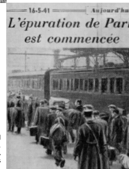
La Une du journal parisien Aujourd'hui . L'épuration, c'est le départ vers les camps du Loiret.