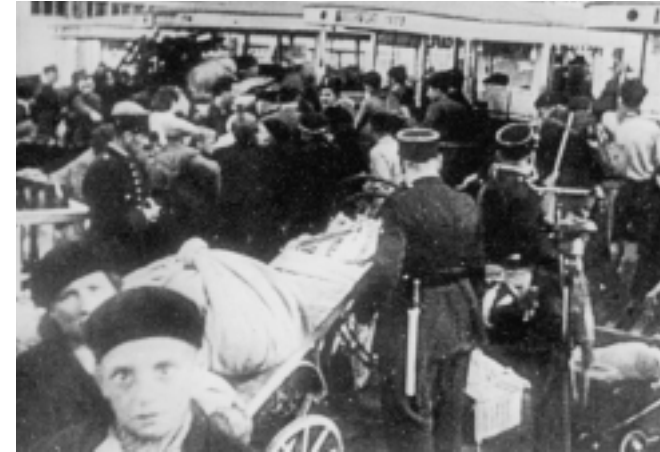
Légende originelle : «Rafle de Juifs à Paris» (sans date).

Un ancien combattant, libéré avec sa famille, noir de crasse, déclare : "Nous sommes sauvés de la mort. J'ai été au front, j'ai été blessé, mais je n'ai jamais vu de choses pareilles."