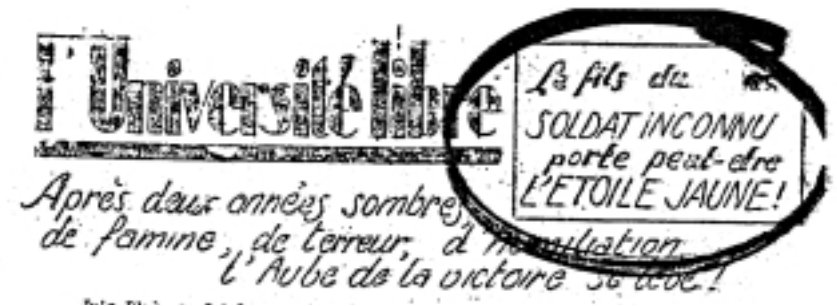
Le journal – clandestin – frappe fort et avec un humour ridiculisant les racistes nazis (numéro de juillet 1942).

de membres du Rassemblement national populaire (groupement de collaborationnistes), boulevard de la Madeleine et rue Royale, incitaient le personnel des cafés à ne pas servir les Juifs et ont forcé ceux qui consommaient sur les terrasses à rentrer à l'intérieur. Vers 17 h 30, des faits analogues se produisent sur les Champs-Élysées, avenue de Wagram et avenue des Ternes, à l'initiative de jeunes gens ayant à leur tête des membres de la Légion volontaire française (Légion antibolchevique) en tenue.