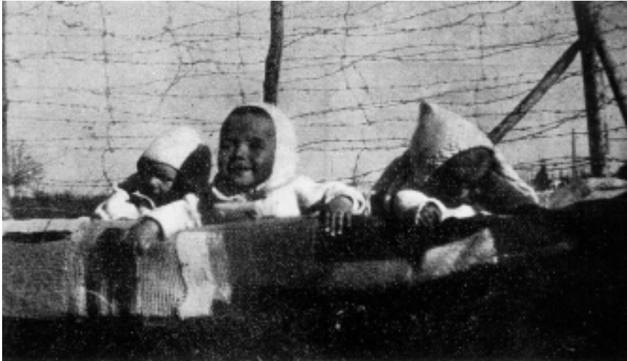
Des bébés derrière des barbelés.

L'entassement augmente par l'afflux des malheureux amenés de Paris ou de province et, étant donné l'absence totale d'hygiène, les épidémies commencent à se propager. Il y a une infirmerie pour les maladies graves, mais pas un seul docteur ; les infirmières de la Croix-Rouge et les religieuses, en trop petit nombre, sont débordées et n'ont aucun moyen médical pour soulager les malades.