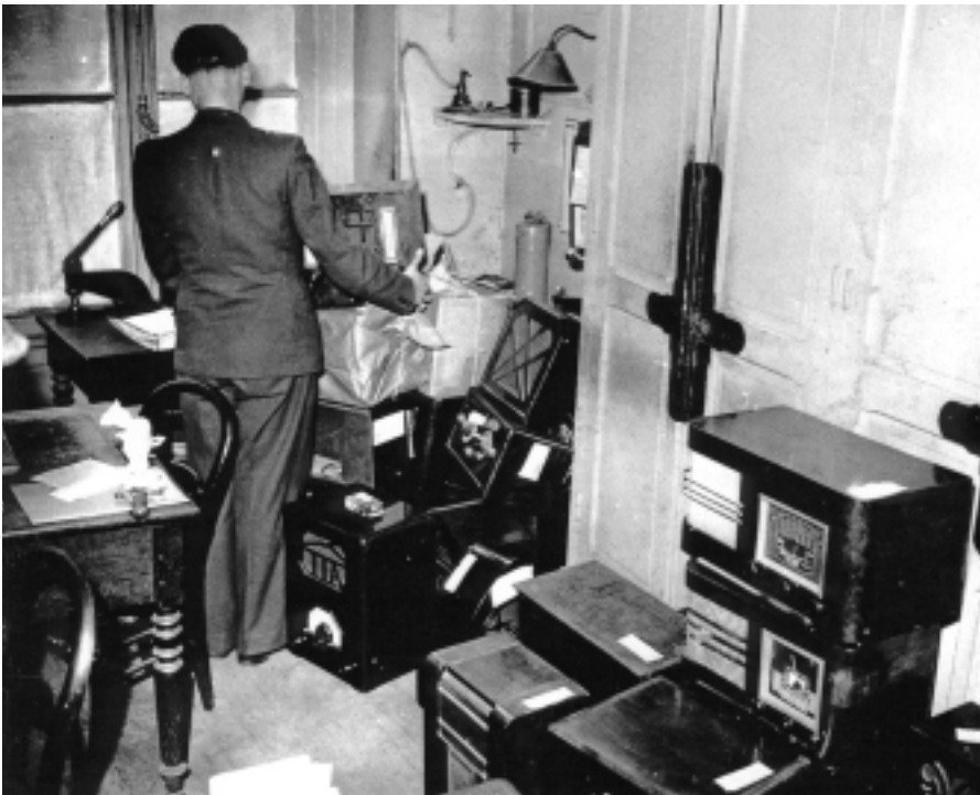
Les Juifs de la zone occupée doivent remettre leurs postes de radio aux commissariats de police. Il leur est interdit de savoir.

La suite des événements confirmera cette espérance : tant que l'homme reconnaîtra dans l'«Autre» son semblable, on ne saurait désespérer de l'avenir. Tant que la France se reconnaîtra dans celle qui est restée fidèle, pendant les années noires, aux valeurs qui fondèrent son identité, elle sauvegardera sa liberté et la grandeur du pays des droits de l'homme. ■