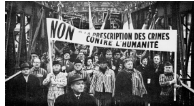
Des déportés en tête d'un défilé populaire à Paris contre la prescription des crimes nazis.