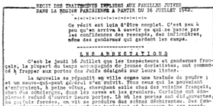
Document «Récit des traitements infligés aux familles juives», édité par le MNCR et Solidarité en août-septembre 1942.

La police, ayant reçu l'ordre de ne pas prendre en considération l'état de santé des personnes inscrites sur les listes, a emmené non seulement des malades graves, mais aussi des morts. Un enfant mort la veille a été emporté dans un drap. On a pris des femmes et des enfants à partir de deux ans, des femmes enceintes dans les septième, huitième et même neuvième mois, des malades tirés de leur lit et portés sur des chaises et des civières ; une femme paralysée a été emmenée sur une chaise roulante. Des vieillards de soixante à soixante-dix ans n'ont pas été épargnés.