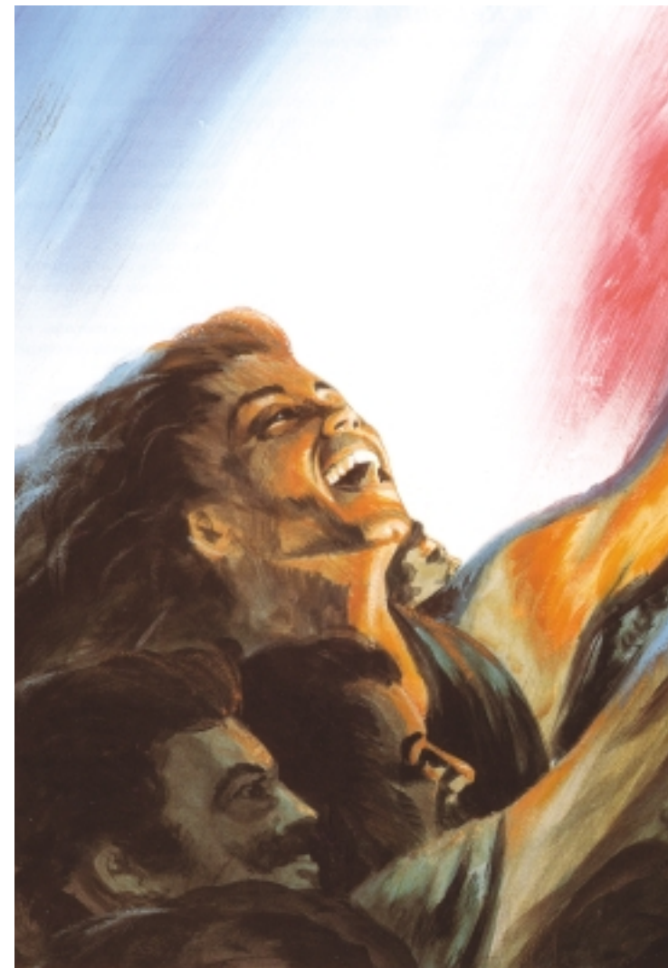
Patrice Larue, La Marseillaise éternelle . Cette illustration est parue dans La Marseillaise , revue coéditée par le secrétariat d'État aux Anciens combattants - ministère de la Défense, et les Éditions Crimée, 1997.