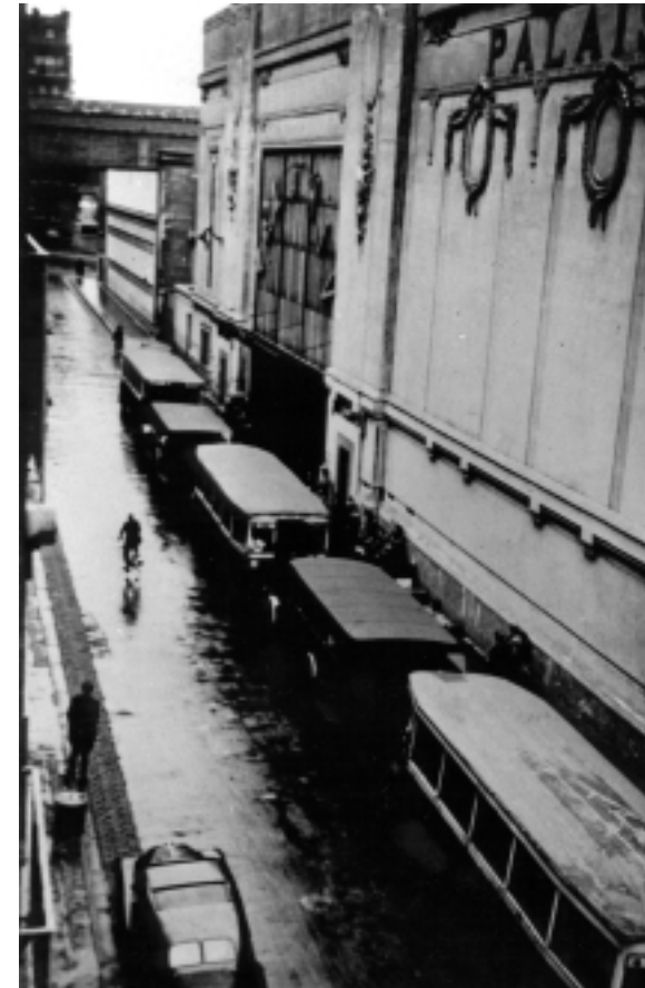
16 juillet 1942 : les autobus devant le Vel' d'Hiv'.

« Mon Dieu ! Mais c'est de la literie juive », allais-je m'exclamer. De loin, j'avais reconnu les couettes et les édredons ouatés et repiqués, dont on