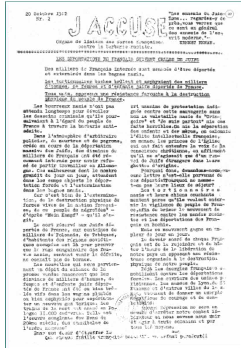
Le journal clandestin Jaccuse , publié par le Mouvement national contre le racisme, daté du 20 octobre 1942, est le premier à annoncer «l'exécution par gaz» des déportés juifs de France.