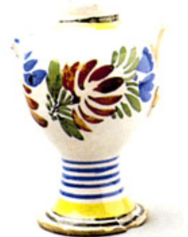
Fig 4 : Biberons en faïence, XVIII e siècle.

Vers 1860 apparaît le second type de biberon, dit biberon à tube ou à long tuyau. Il se compose d'un flacon de verre généralement assez plat, pourvu d'un bouchon et d'un tuyau de caoutchouc raccordé à l'intérieur à un tube de verre, qui descend lui-même presque jusqu'au fond de la bouteille. A l'extérieur, le tuyau se termine par une tétine. C'est tout de suite un succès colossal. Plusieurs modèles sont proposés : le Darbo, le Laroche, le Duquesnoy, le Raniol, le Lauvergne... Mais le plus célèbre, et d'ailleurs passé à la postérité, est le Robert. La maison Robert, fondée en 1869 à Dijon, connaît alors une extension formidable. En 1873, le modèle à long tuyau obtient la Médaille d'Honneur à l'Exposition Universelle de Paris et l'année suivante celle de la Société protectrice de l'Enfance de Marseille. Hélas ! On ne s'aperçut que tardivement des méfaits de ces sortes de biberons, le lait caillé stagnant et fermentant à l'intérieur du