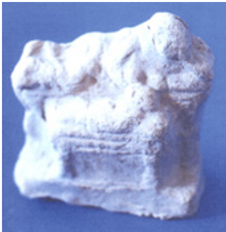
Fig. 1 : Terre cuite du Musée archéologique national de Tarente : femme allaitant (DR).

Voyons quelques objets utilitaires et quelques scènes figurées de différentes époques. Une adorable terre cuite du musée archéologique national de Tarente, chronologi-