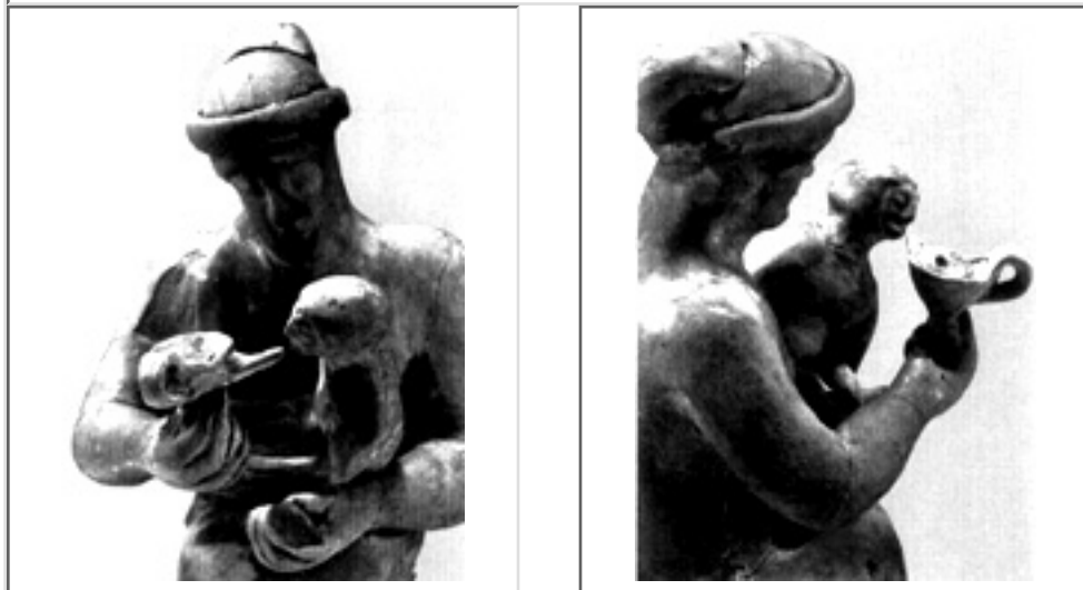
Fig. 9 et 10 : Terre cuite béotienne déposée au Musée d'art et d'histoire de Genève : femme nourrissant son enfant au biberon. Vue d'ensemble (en haut). Vue rapprochée, profil droit de la femme (ci-contre).