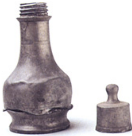
Fig. 3 : Biberon en étain, XVIII e siècle.

On trouve alors des biberons en bois, en cuir, en faïence ou en étain, et leur forme se rapproche de celle d'un flacon au col rétréci pour faciliter la succion. Les résultats de ces premiers essais d'allaitement artificiel sont catastrophiques, et plus des trois-quarts des nouveau-nés meurent.