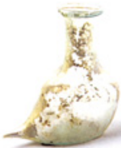
Fig. 1 : Biberon en verre dit "guttus" (Gaule romaine).

Toutefois, la mise en nourrice était aussi une pratique à laquelle les Anciens avaient fréquemment recours. En revanche, et bien que l'image de la louve allaitant Romulus et Rémus soit présente dans tous les esprits, on s'interroge sur les débuts de l'allaitement artificiel au moyen d'un lait animal et sur l'apparition des premiers biberons.