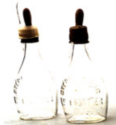
Fig. 8 : Biberon-stérilisateur.