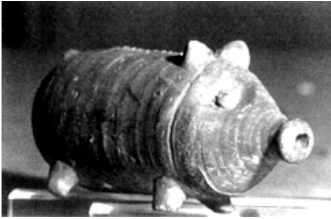
Fig. 6 : Terre cuite du Musée archéologique national de Tarente : probablement petit vase à bouillie.

Certains petits vases, d'origine incertaine, sont peut-être des biberons, ou du moins des vases à bouillie pour l'enfant en cours de sevrage, souvent de forme amusante, petits cochons obèses par exemple, comme il en est plusieurs à Tarente ( fig. 6 ).