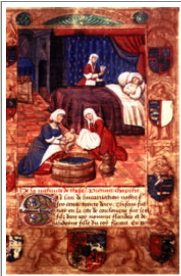
"Un verre de vin pour reconforter l'accouchée". Les soins après l'accouchement. Histoire ancienne. XVe siècle.

Si le geste caractéristique du métier de sage-femme est le moment où elle reçoit l'enfant, ses connaissances sont loin de se limiter aux techniques de l'accouchement. En amont, on lui apprenait à connaître les parties génitales externes et internes afin de pouvoir observer, expliquer et traiter leurs modifications pendant la grossesse et lors de l'accouchement. Cette connaissance s'acquerrait d'abord par une observation visuelle et ensuite par la palpation : c'est pourquoi les parties génitales leur sont décrites en termes de "charnu", "mou", ou "rugueux" et leurs dimensions mesurées en "doigts". Elles doivent tout savoir sur les maladies génitales, qu'elles savent soigner, sur les monstruosité (siamois, enfants aux membres surnuméraires, etc.), les positions du fœtus in utero et les manières de les corriger (version podalique, etc.), les naissances multiples (on prévoit jusqu'aux quintuplés) et, naturellement, sur les menstruations, leur régularité, leur débit, leur variation selon la profession de la femme (cantatrice, paysanne), ou son rythme de vie (oisive, laborieuse...).