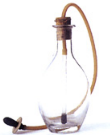
Fig 6 : Biberon à long tuyau, fin XIX e siècle.

Au lendemain de la première guerre mondiale, avec l'avènement des premiers laits maternisés acceptables, le biberon est devenu