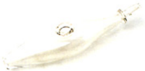
Fig 5 : Biberon dit limande, XIX e siècle.

un objet essentiel. Le "pyrex" s'impose, simple bouteille graduée à goulot étroit résistant aux chocs thermiques et pouvant aller au feu.