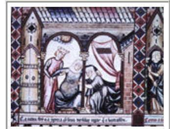
Cantigas de Santa Maria, Madrid Escorial. Espagne, XIIIe siècle. Une sage-femme palpe le ventre de la parturiente.

Enfin, la sage-femme du Moyen Age doit prendre soin du nouveau-né : elle l'examine, vérifie ses réflexes et son intégrité corporelle en lui faisant effectuer une gymnastique néonatale. Elle le lave et l'habille. Lui incombe aussi la responsabilité de parachever l'œuvre de la nature en remodelant l'enfant si besoin est : massage du crâne déformé, lissage du nez, aplatissement des oreilles, redonnant forme humaine au bébé qui a souffert d'une trop longue naissance. Rares sont les informations sur le "remodelage" du corps de l'enfant qu'effectue la sage-femme au moment de la naissance : souvent déformée, la tête de l'enfant est massée, son nez régularisé, ses oreilles sont recollées, en des gestes sans doute plus symboliques qu'efficaces. Son travail n'est pas achevé pour autant : elle doit encore se retourner vers l'accouchée, aider si besoin à la sortie du placenta, soigner les déchirures éventuelles du périnée, les descentes de matrice, masser les seins lors de la montée de lait, et surveiller l'état de santé de la parturiente en demeurant à ses côtés aussi longtemps que nécessaire.