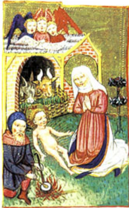
Joseph préparant la bouillie de l'Enfant Jésus. Bible historiée, vers 1430. Heidelberg, Bibl. Universitaire, Codex Pal. Germ. 148.

vaisselle n'était pas choisi au hasard : un compte daté de 1281 précise que la poêle à cuire la bouillie, les écuelles et les petites cuillers destinées à nourrir un bébé, sont en argent "pour être plus nettement [proprement] et à couvert" 17 . L'alimentation artificielle n'était donc pas pratiquée sans précautions.