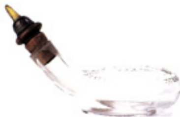
Fig. 7 : Biberon à tétine, début XX e siècle.