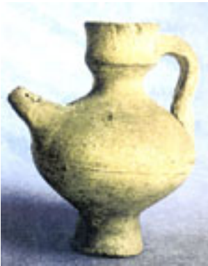
Biberon. Terre cuite ; Fécamp, Musée de l'Enfance - Musée Centre des Arts, XIV e ou XV e siècle.

C'est très tôt, si l'on en croit les images médiévales, que les mères complètent l'allaitement au sein par des bouillies : c'est qu'elles souhaitent, telles, au XIII e siècle, les paysannes de la Dombes dont nous parle le prédicateur dominicain Etienne de Bourbon, avoir des enfants "gros et gras" 12 , la surcharge pondérale étant pour elles synonyme de bonne santé. Sans doute même les gavent-elles : à la même période, le pédagogue catalan Raymond Lulle accuse les femmes de faire manger de force de la bouillie aux enfants de moins d'un an, alors, dit-il dans son livre Evast et Blaquerne , qu'"ils n'ont mie tant fort digestive [...] que ils puissent cuire viandes ni le papa...". On trouve à l'inventaire de l'hôpital d'Hesdin, où venaient accoucher les pauvres femmes, mention de poêlons à bouillie "pour faire papins pour les petits enfants", ce qui semble confirmer la donnée de bouillies dès les premiers jours de la vie 13 . Du reste, dans le Roman de la Rose , on voit (aux vers 10 116 et suivants) que Pauvreté allaite Larcin "de son lait et sans autre bouillie", ce qui laisse entendre que si l'on en a les moyens, on nourrit de bouillie les bébés. Aux bouillies s'ajoutaient enfin d'autres nourritures, telles les pommes cuites qu'il faut donner au nourrisson pour qu'adulte il soit, ainsi que nous l'affirment avec humour les Evangiles des Quenouilles , au XV e siècle, un homme courtois et frugal 14 .