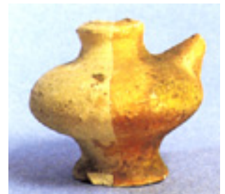
Fig. 2 : Biberon en terre cuite (Moyen Age).

Du Moyen Age à l'aube du XX e siècle, les "petits pots" vont servir à pratiquer cet allaitement artificiel. En bois, en faïence ou en poterie, de formes diverses, ils s'apparentent soit aux gutti de l'Antiquité avec un bec verseur sur le côté, soit aux canards qui servent encore aujourd'hui à faire boire les malades alités. On les utilise tantôt en gavage, en faisant doucement couler le liquide dans la bouche du nourrisson, tantôt en succion au moyen d'un chiffon, le "drapeau", enroulé autour du bec verseur pour former tétine. En même temps que le recours aux petits pots, on pratique aussi l'allaitement directement au pis de l'animal.