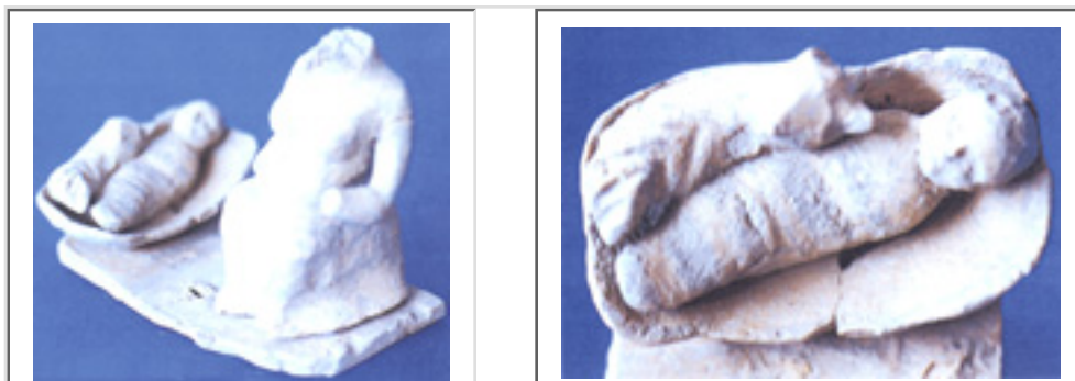
Fig. 2 et 3 : Terre cuite du Musée archéologique national de Tarente : groupe à trois personnages. La femme, l'enfant et le chien. Détail : l'enfant et le chien (DR).

allaite ; néanmoins elle est manifestement enceinte, et son ventre particulièrement distendu vers le bas semble bien indiquer une grossesse déjà avancée : ou bien c'est un échec de la contraception par l'allaitement (qu'il s'agisse de la mère naturelle ou de la nourrice), ou bien c'est une mère qui n'a pas nourri son enfant. Notons que la vie sexuelle de la nourrice mercenaire était surveillée, précisément pour éviter que des relations amoureuses ou une grossesse intempestive nuisent à la qualité de son lait ou viennent à le tarir ( fig. 2 et 3 ).