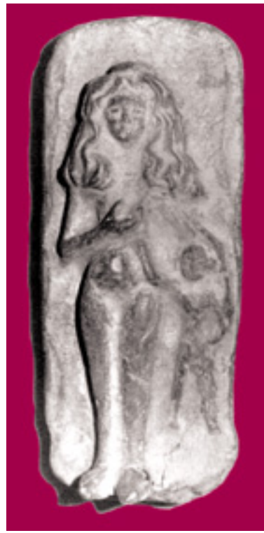
Fig. 5 : Terre cuite du temple d'Asclépios à Athènes (propriété privée) : ex-voto d'une femme qui a du mal à allaiter son enfant.

On connaît aussi l'enfant Ménogénès, de Smyrne, lui aussi probablement privé de lait maternel et mort ainsi, en 41 de notre ère : tel qu'il est représenté sur sa stèle funéraire, il s'agrippe des deux mains à un sein isolé, volumineux, et dont la forme peu réaliste rappelle les ex-voto qui viennent d'être évoqués.