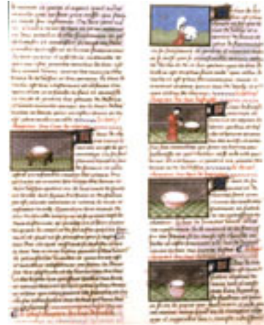
Les différents types de laits : lait de chèvre, lait d'ânesse, lait de jument, lait de truie. Paris, BNF, manuscrit français 22 532. Barthélemy l'Anglais, Livre des Propriétés des Choses, France, copie du XV e siècle d'un ouvrage du XIII e siècle (DR).