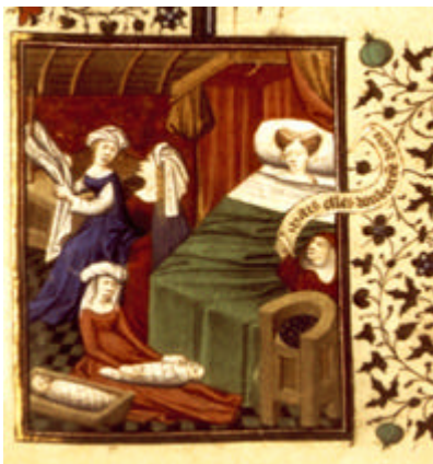
La critique des sages-femmes. Un médecin, assistant - de loin - à un accouchement, reproche aux sages-femmes de douter de l'existence de Dieu - France, XV e siècle. Paris, BNF, ms fr 20065 627.

A la demande de la justice, elles procèdent à des expertises médicales : ainsi examinent-elles les femmes enceintes battues pour savoir si elles vont perdre leur enfant, ce qui aggrave la qualification du crime. Outre l'aide accordée à la justice laïque, les sages-femmes se font les auxiliaires des tribunaux ecclésiastiques en pratiquant des examens de virginité, exigés par exemple lors des demandes d'annulation de mariage, ou, telles celles qui ont vérifié la virginité de Jeanne d'Arc, en participant à des enquêtes de moralité.