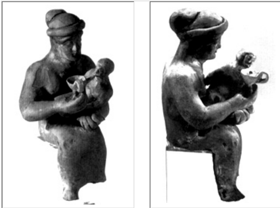
Vues d'ensemble et vues rapprochées, profil droit de la femme.

Ces vignettes historiques donneront, je l'espère, le désir d'en savoir plus et de consulter la bibliographie qui suit.